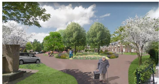
Afbeelding: impressie Asylplein ontwerp Buro Lubbers

In het huidige ontwerp zijn aan de buitenrand vaste planten in combinatie met groenblijvende bodembedekkers ingetekend. Dit betekent dat er het gehele jaar rond een aantrekkelijker groenbeeld is. De pergola's staan aan de zijkanten, waardoor je vanuit de Asylstraat direct zicht krijgt op het Zeemansasyl. Het aantal parkeerplaatsen blijft gelijk. Verder zijn de rozen verplaatst naar de belangrijkste twee plekken: de entree van het plein en rondom de Nymph. Een aantal omwonden zien graag meer (diversiteit aan) rozen in het plan terug. Hierover is contact tussen beide partijen. Verder wordt de wens van omwonenden voor meer coniferen aan de achterzijde in het plan verwerkt.