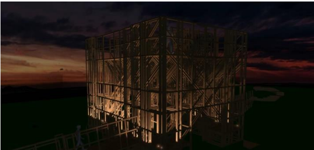
Afbeelding: impressie verlichting Noordpoort

Om de beleving van bastion IX te vergroten is een voorstel gemaakt voor de beleving en verlichting op en rond de Noordpoort.