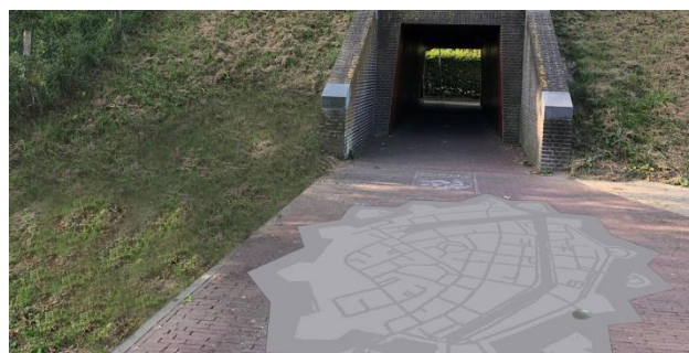
Afbeelding: impressie routetegel

In het straatoppervlak worden de contouren van de vesting aangebracht om aan te geven dat je in een vestingstad bent. Als je vervolgens richting de Kaaistraat loopt komt hier opnieuw een vestingplattegrond op de grond die aangeeft waar je jezelf bevindt. Eenmaal door het tunneltje loop je de vestingwallen op waar je opnieuw stukken van de plattegrond tegenkomt. Op deze tegels wordt een deel van de plattegrond van de vesting uitgebeeld, de plek van de tegel zelf en enkele belangrijke plekken en gebouwen in de stad. Dit vergroot de oriëntatie en versterkt de relatie tussen de vesting en de binnenstad. Op onderstaande afbeelding zie je een eerste ontwerp van de routetegel bij de Kaaistraat.