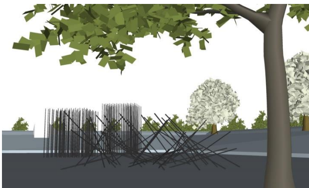
Afbeelding: impressie pieken

Een opstelling van pieken op bastion III vertelt het verhaal van de Tachtigjarige Oorlog. Pieken zijn stokken met een stalen punt en belangrijke wapens uit die periode.