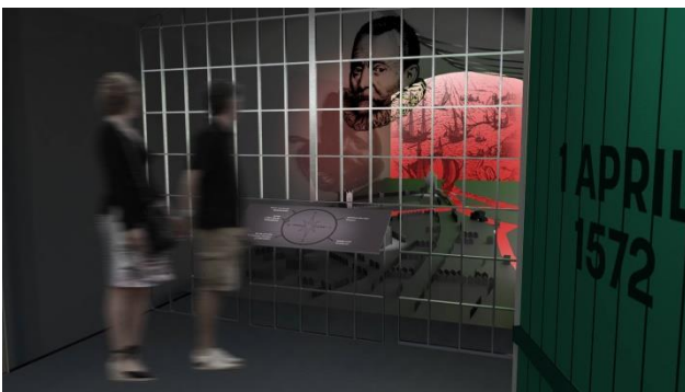
Afbeelding: impressie tentoonstelling Kazemat

Het voorstel is om het einde van de Tachtigjarige Oorlog en het ontstaan van Nederland op een abstracte wijze weer te geven. Verder is er een lichtplan uitgewerkt waarmee de avondbeleving van Bastion IX subtiel vergroot wordt, zonder dat dit tot lichtoverlast leidt. Daarnaast is er door bureau Kinkorn een voorstel gemaakt voor de inrichting van de kazemat op Bastion IX. Het idee is de kazemat te gebruiken als tentoonstellingsruimte. Diverse personages uit de 16e eeuw vertellen hier het verhaal van 1 april 1572 vanuit hun perspectief.